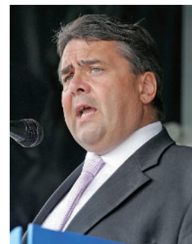
Sigmar Gabriel – der neue Bundeskanzler?

Noch am selben Abend wurden die Stimmen ausgezählt und die ersten Ergebnisse im Fernsehen verkündet. Die SPD konnte einen großen Wahlsieg feiern – sie holte 42 % der Stimmen. Ihr Spitzenkandidat Sigmar Gabriel wird somit zum neuen Bundeskanzler. Die Amtszeit von Angela Merkel ist nun vorbei – das wurde aber auch Zeit, schließlich war sie schon 20 Jahre lang Bundeskanzlerin. Da die SPD jedoch keine absolute Mehrheit erreichen konnte, muss sie eine Koalition mit einer anderen Partei eingehen. Ich denke, sie wird mit den Linken und den Grünen zusammengehen. Die Grünen haben 6 % der Stimmen geholt und die Linken 4 %. So wären sie zusammen ja über 50 %. Vielleicht gehen sie aber auch mit der AfD zusammen, schließlich haben sie die gleichen Interessen in Bezug auf Flüchtlinge und die EU. Ich bin schon sehr gespannt.