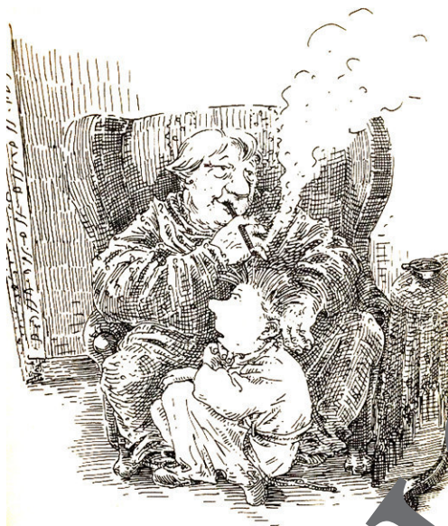
Quelle beider Bilder: © Amelie Glienke, in: Roald Dahl, „Hexen hexen“. Rowohlt, 1990. S. 13, 16

Stell dir vor, du bist bei einem Verlag für die Herausgabe einer neuen Ausgabe von „Hexen hexen“ verantwortlich. Dazu vergleichst du die Illustrationen der Ausgabe von 1990 mit denen der aktuellen Ausgabe.