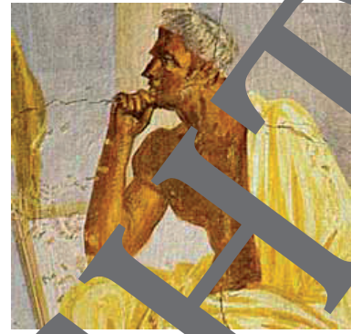
Wikipedia. Gemeinfrei gestellt.

In den folgenden Posts stellt unser Sprecher „Tibull“ seinen Lebensentwurf vor, der für die Elegie typisch ist.