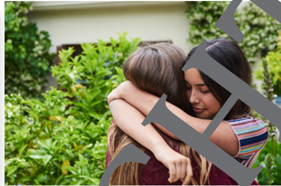
Texto: Fuente: Miriam: Nuestro primer verano separadas, revista Bravo, Bauer Media Group, número 43 del 05/08/2014, Foto: © Flashpop/DigitalVision

Miriam, 14 (mail): ¡Hola! Todos los años me reúno con mi BF del verano en la playa. Pero me acabo de enterar de que se va a otro sitio y no nos vamos a pasar juntas las vacas, ¡será el peor summer de mi vida!