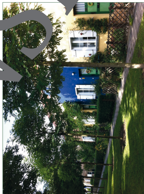
⑤ Gartenstadt Falkenberg (Akazienhof)