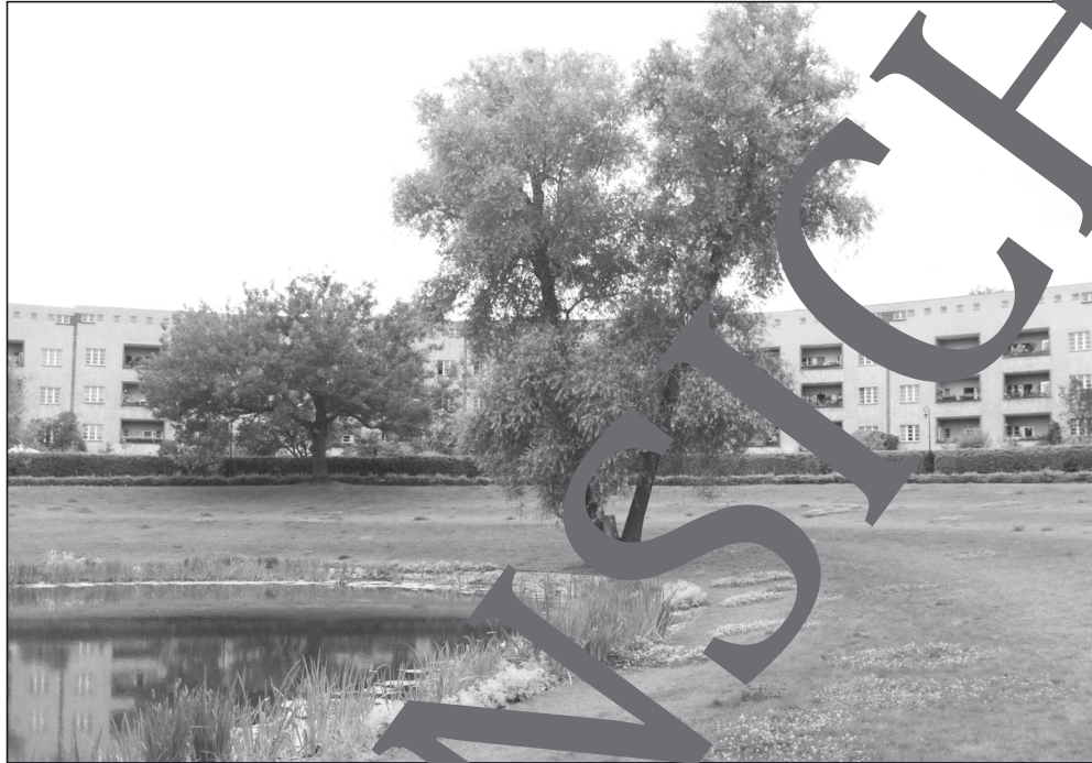
Das „Hufeisen“ in der gleichnamigen Siedlung in Berlin-Britz

Nach dem Ersten Weltkrieg fehlten in Berlin etwa 100 000 Wohnungen. Es entstanden mehrere Großsiedlungen im Rahmen des Neuen Baus, die dem Massenwohnbau ein freundlicheres Gesicht gaben. Die Einbeziehung von Grünflächen, die Abkehr von der Blockrandbebauung sowie eine neuartige Fassadengestaltung mithilfe von Farbe stellten ein neues städtebauliches und architektonisches Konzept dar.