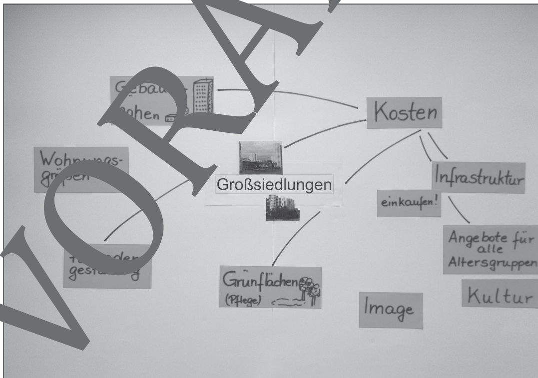
Erster Zustand der Lernlandkarte