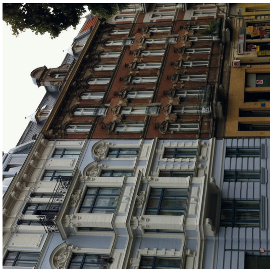
③ Fassaden von Mietskasernen