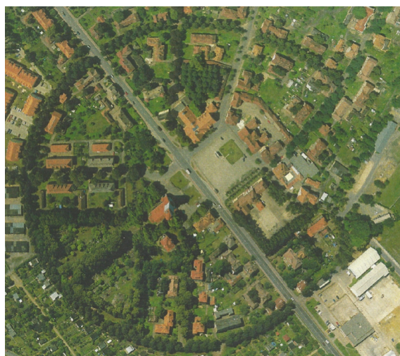
④ Gartenstadt Marga (Luftbild)