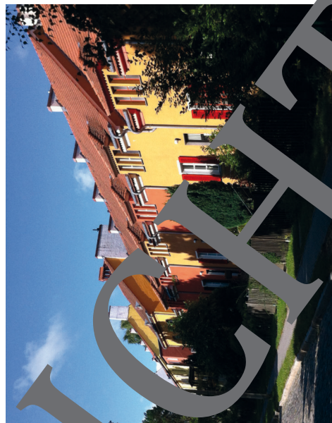
⑥ Gartenstadt Falkenberg (Gartenstadtweg)