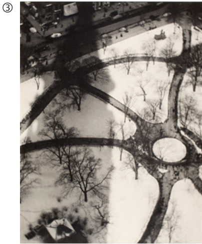
Alvin Langdon Coburn: Der Oktopus, 1909; Platin-Palladium-Druck, 42,2 x 32,2 cm; George Eastman House, Rochester, New York