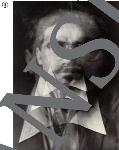
Alvin Langdon Coburn: Portrait Ezra Pound, 1916; Silbergelatineabzug, 9 x 12 cm; George Eastman House, Rochester, New York