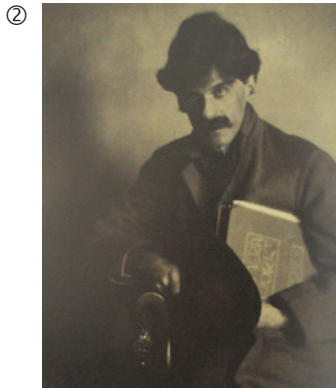
Alvin Langdon Coburn: Alfred Stieglitz mit einer Ausgabe von Camera Work, 1903; Platindruck, 23,8 x 16,7 cm; MoMA, New York