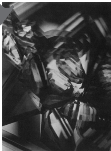
Alvin Langdon Coburn: Vortograph, 1917; Silbergelatineabzug, 46,2 x 34,6 cm; George Eastman House, Rochester, New York