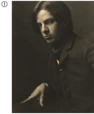
Alvin Langdon Coburn: Selbstportrait im Alter von 21, 1905; Platindruck, 23,8 x 16 cm; MoMA, New York