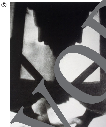
Alvin Langdon Coburn: Vortograph Ezra Pound, 1916; Silbergelatineabzug, 28,4 x 19,9 cm; George Eastman House, Rochester, New York