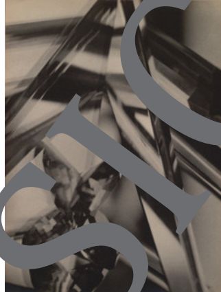
Alvin Langdon Coburn: „Der Oktopus“ (1909) und „Vortographs“ (1916/17) © Alvin Langdon Coburn

Die Serie der „Vortographs“ von Alvin Langdon Coburn markiert die Geburtsstunde der abstrakten Fotografie. Zwar hatte man in Experimenten mit verschiedenen Materialien schon zuvor ungegenständliche Ergebnisse erzielt, doch ist es der Verdienst Coburns, diese Ästhetik erstmalig systematisch verfolgt zu haben. Mit einer Spiegelkonstruktion, dem „Vortoskop“, löste er das fotografische Bild optisch von seinem vorliegenden Gegenstand. Dies führte zu einem Bruch mit der damals üblichen, indes bis heute gängigen Vorstellung von der Fotografie als Spiegel der Realität.