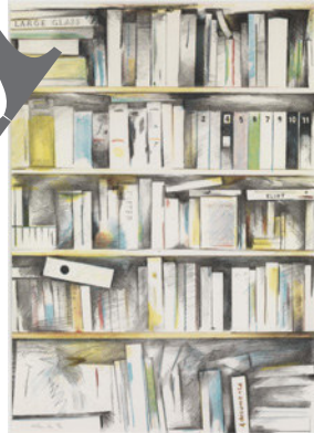
Richard Hamilton: Archive I, 1981