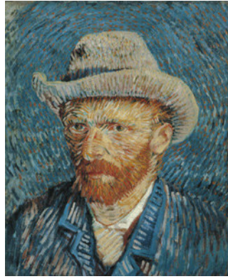
Van Gogh: Selbstporträt mit Filzhut, 1887/88