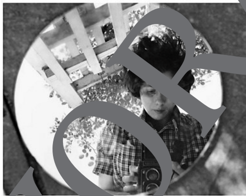
Vivian Maier: Selbstporträt, 1953