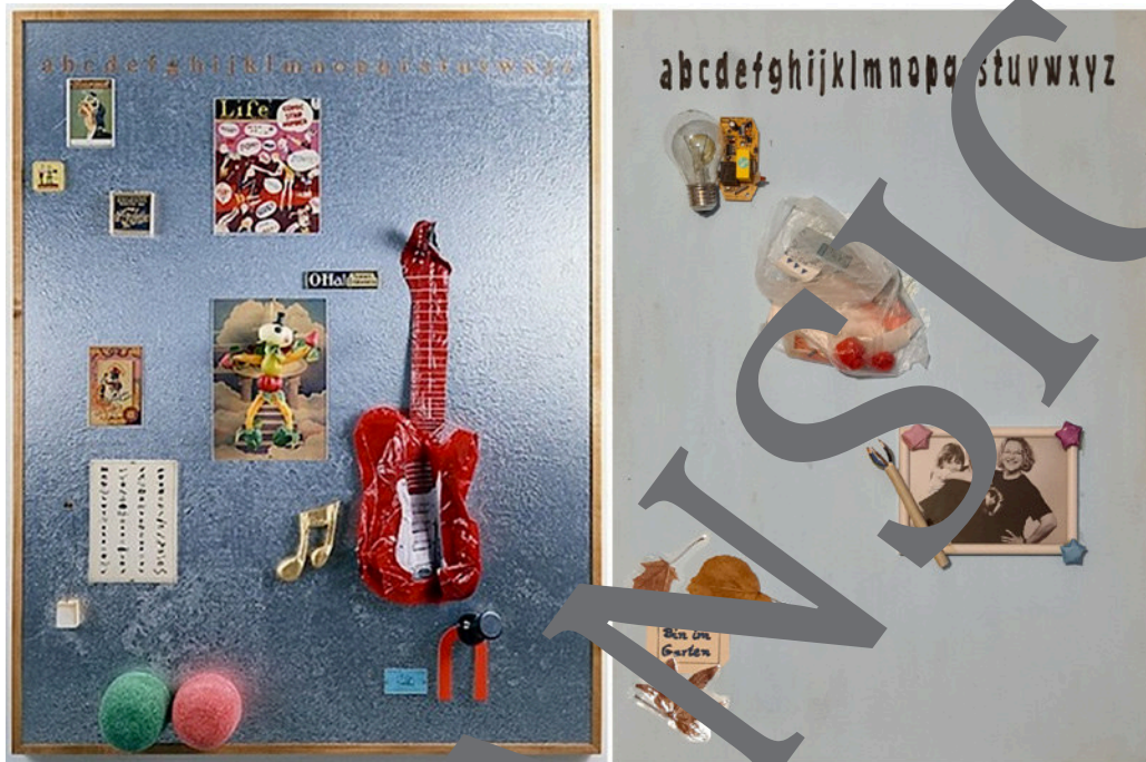
rechts: Beispielergebnis