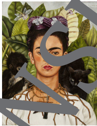
Frida Kahlo: Selbstbildnis mit Dornenhalsband und Kolibri, 1940