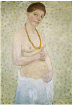
Paula Modersohn-Becker: Selbstbildnis am 6. Hochzeitstag, 1906