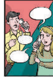
Illustration: Julia Lenzmann

Trouve un partenaire. Plie la feuille au milieu. L'un d'entre vous est le partenaire A, l'autre est le partenaire B. Jouez le dialogue. Souvenez-vous, il y a plusieurs façons correctes de formuler les phrases.