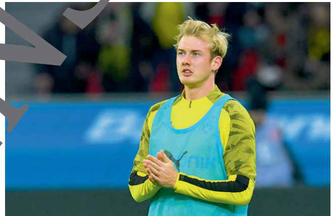
Bild 1: ; Bild 2: ; Bild 3: , Bild 4: