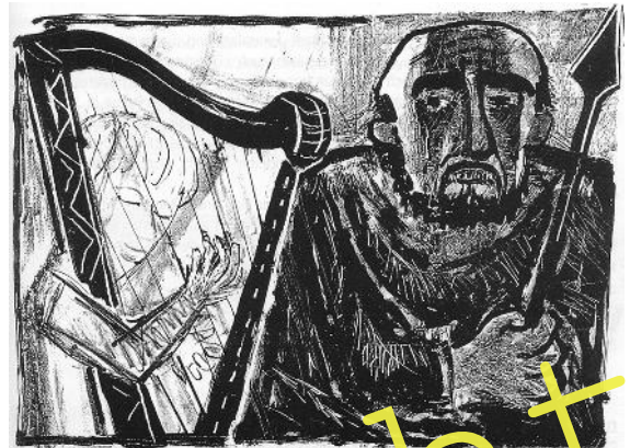
David mit der Harfe vor König Saul von Otto Dix (Lithographie von 1938).

Die Lernenden erforschen die verschiedenen Lebensstationen Davids und seine Erfahrungen mit dem Gott Israels. Sie untersuchen anhand der David-Saul-Geschichte das alttestamentliche Gottesbild und erörtern auf Grundlage der David-Goliath-Begegnung die Eigenart und Symbolhaftigkeit biblischer Texte. Das ästhetische Lernen anhand von Wahrnehmungsübungen und der Arbeit mit Bildern und Standbildern steht dabei im Vordergrund.