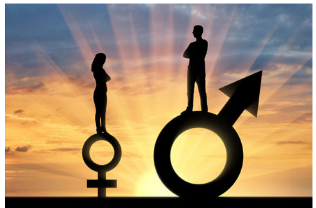
Bild 1: © Mono/iStock/Getty Images Plus. Bild 2: takasuu/iStock/Getty Images Plus. Bild 3: Martin Harvey/Photodisc. Bild 4: Diji/iStock/Getty Images Plus. Bild 5: Daria Nipot/iStock/Getty Images Plus. Bild 6: © Victor Aheiev/iStock/Getty Images Plus.