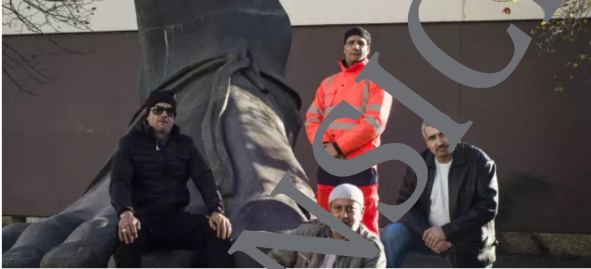
Les anciens « Messagers » aujourd'hui.