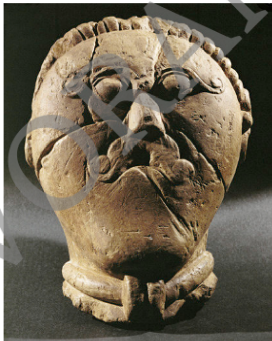
Keltischer Männerkopf mit Halsring/Torque.

Diodoros, Historische Bibliothek. Übersetzt von Julius Friedrich Wurm. Marix, Wiesbaden 2014