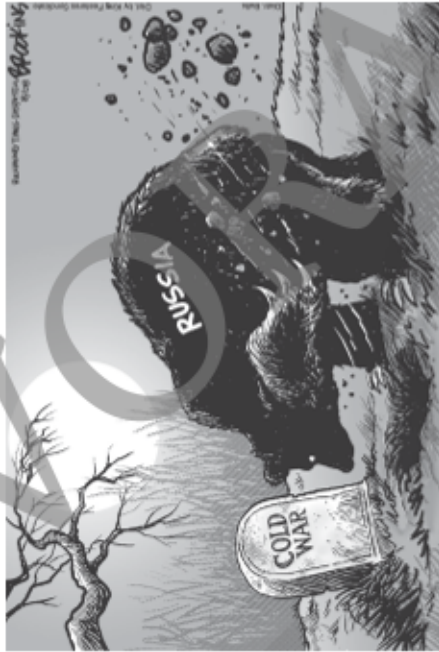
© Gary Brooks/Kings Features Syndicate/Bulls Press/Richmond Times Dispatch.

Der Ukraine-Konflikt ist seit seinem Ausbruch eines der zentralen Themen der internationalen Politik. Unzählige Karikaturen greifen ihn aus unterschiedlichen Perspektiven auf.