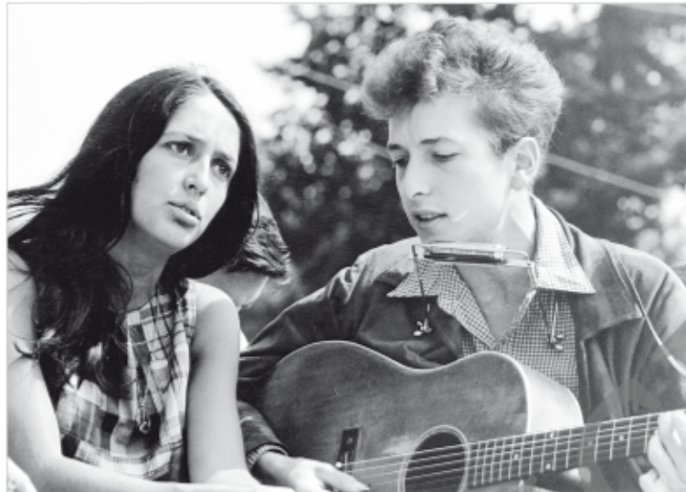
Bob Dylan und Joan Baez (1963)