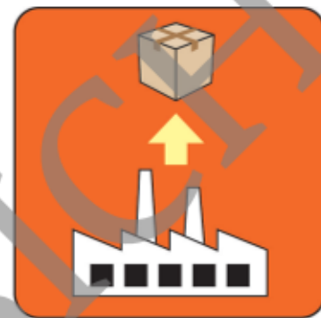
Illustration: Doris Köhl