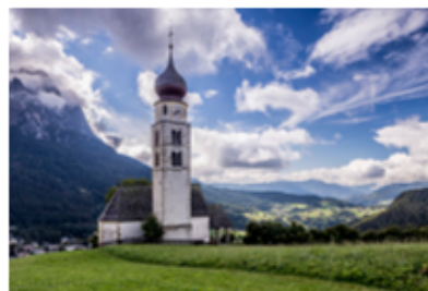
Bild 1: © Sean Justice/DigitalVision; Bild 2: © Digital Zoo/DigitalVision; Bild 3: © Fotosearch/iStock/Getty Images Plus; Bild 4: © Rosemary Calvert/Stone; Bild 5: © FotoLesnik/iStock / Getty Images Plus; Bild 6: © makkaya/E+; Bild 7: © Antagain/E+; Bild 8: © Julian Elliott Photography/Stone