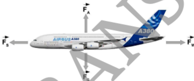
Abb. 2: Kräfte beim beschleunigungsfreien Horizontalflug; Grafik: Airbus und W. Zettlmeier

Beschreiben Sie die eingezeichneten Kräfte hinsichtlich ihrer Entstehung und Bedeutung für das Fliegen. Recherchieren Sie dazu im Internet und in entsprechenden Lehrbüchern – dieser Hinweis gilt auch für alle weiteren Fragestellungen.