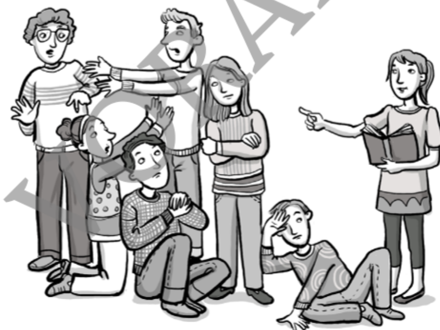
Illustration: Julia Lenzmann