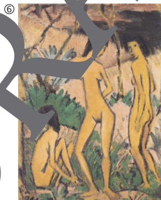
Otto Mueller: Drei Frauen, um 1919; Leimfarbe auf Hessian, 119 x 88,5 cm; Brücke-Museum, Berlin