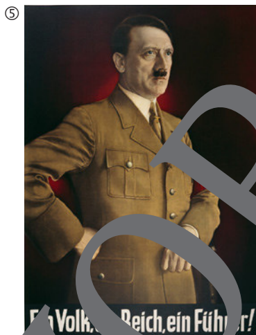
Heinrich Knirr: Ein Volk, ein Reich, ein Führer!, 1938/39