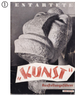
Titelseite des Ausstellungsführers mit Werk von Otto Freundlich: Der Neue Mensch, 1912