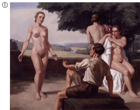
Ivo Salinger: Das Urteil des Paris, 1939