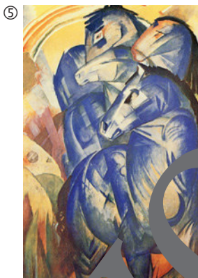
Franz Marc: Der Turm der blauen Pferde, 1911; Öl auf Leinwand, 200 x 130 cm; Original verschollen