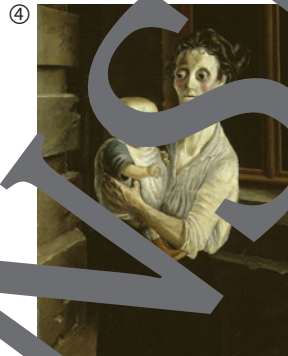
Otto Dix: Frau mit Kind, 1921; Öl auf Leinwand, 120 x 82 cm; Galerie Neue Meister, Dresden