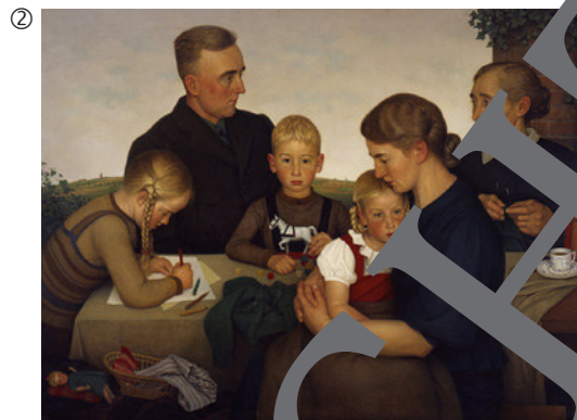
Adolf Wissel: Kahlenberger Bauernfamilie, 1939