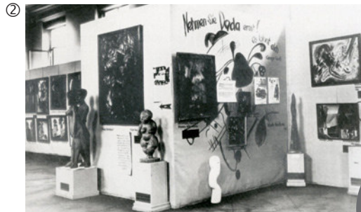
Blick in die Ausstellungsräume; Zentrum Paul Klee