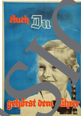
© Adolf Wissel: Kahlebergers Bauernfamilie, 1939 Unbekannter Urheber: Auch du gehörst dem Führer, um 1939

Was verstanden die Nationalsozialisten unter Kunst? Welche Rolle spielte Politik und Propaganda das künstlerische Schaffen in der NS-Diktatur? Und wie war die Haltung zur modernen Kunst? Mit diesen Fragen setzen sich die Schülerinnen und Schüler im vorliegenden Beitrag zur Kunst im Nationalsozialismus und zum propagierten Menschenbild auseinander. Sie betrachten und analysieren dazu insbesondere Gemälde und Plakate und vertiefen sich in eigenen gestaltungspraktischen Auseinandersetzungen dem Thema auch unter aktuellen Aspekten.