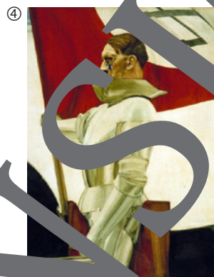
Hubert Lanzinger: Der Bannerträger, um 1934