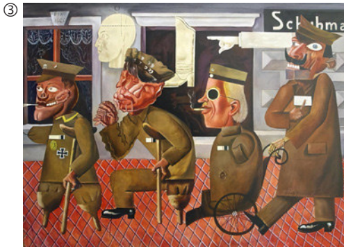
Otto Dix: Die Kriegskrüppel, 1920; Öl auf Leinwand; Stadtmuseum Dresden