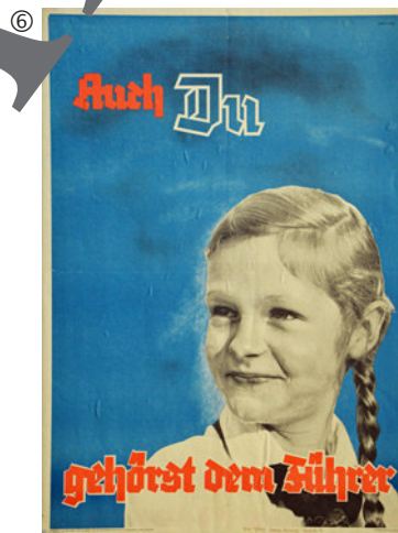
Unbekannter Urheber: Auch Du gehörst dem Führer, um 1939