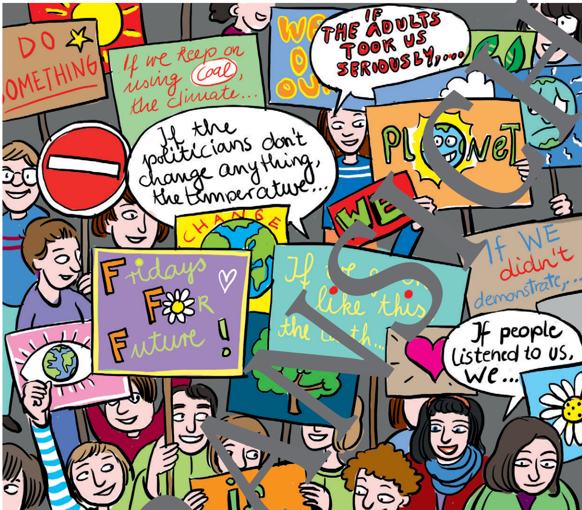
Illustration: Julia Lenzmann

Do you know Greta Thunberg? What is she famous for?