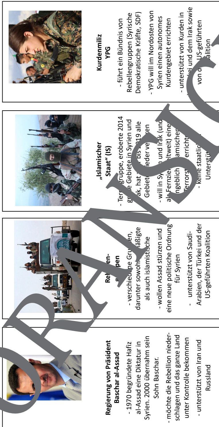
Bild: Präsident Baschar al-Assad