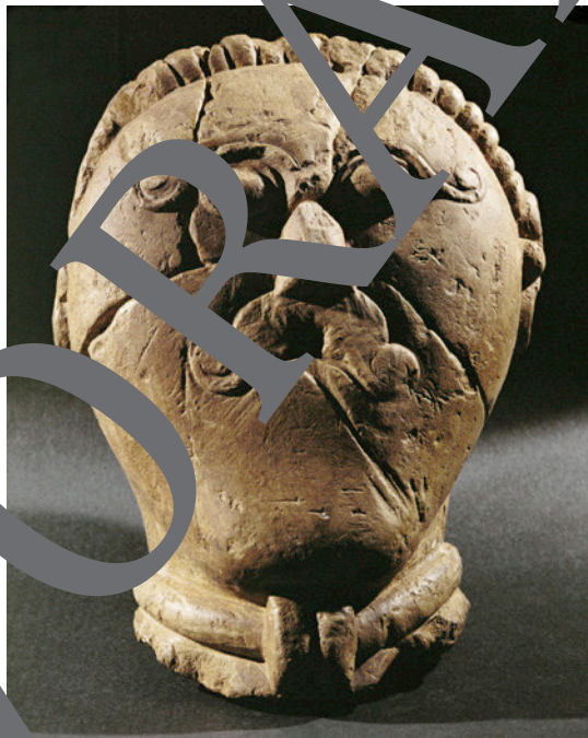
Keltischer Männerkopf mit Halsring/Torque.

Diodoros, Historische Bibliothek. Übersetzt von Julius Friedrich Wurm. Marix, Wiesbaden 2014