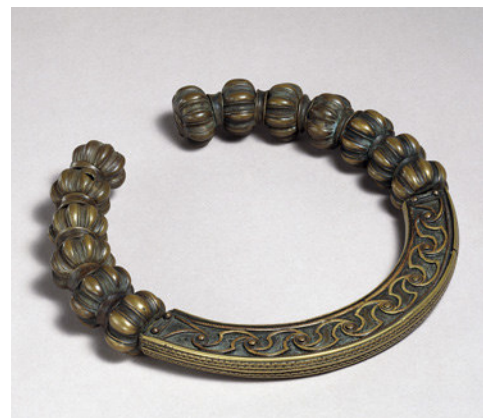
Torque: Halsreif aus dem 2. bzw. 3. Jahrhundert v. Chr., wurde von Männern und Frauen der reichen Oberschicht getragen.