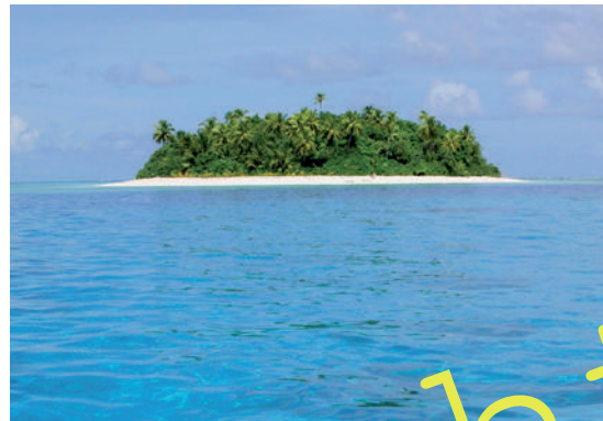
Bedroht vom Untergang – das paradiesische Teafunliku gehört zum Inselstaat Tuvalu.

Der Inselstaat Tuvalu im Südwesten des Pazifischen Ozeans östlich von Papua-Neuguinea, der nur 26 Quadratkilometer groß ist, ragt durchschnittlich nur zwei Meter aus dem Wasser. Durch den steigenden Meeresspiegel haben die etwa 10 500 Bewohner mit verseuchtem Trinkwasser, dem Ausfall von Ernten und Überschwemmungen zu kämpfen. Die Kinder der Familie Alesana seien wegen ihres Alters besonders stark durch Naturdesaster und Folgen des Klimawandels gefährdet, urteilte das Einwanderungstribunal in Neuseeland.