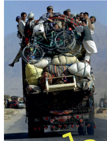
Afghanische Flüchtlinge haben das Nötigste zusammengepackt.

Weltweit sind derzeit weit mehr als 50 Millionen Menschen auf der Flucht. Doch nur etwas mehr als ein Drittel von ihnen gilt nach dem Völkerrecht als Flüchtlinge. Die fünf Staaten, die 2014 am meisten Flüchtlinge aufgenommen haben, sind Pakistan, der Iran, Libanon, Jordanien und die Türkei. Der weitaus größte Teil der Flüchtlinge – 33,3 Millionen Menschen – sind Binnenvertriebene (Internally Displaced Persons), die innerhalb ihres eigenen Landes fliehen. Die Hälfte der Flüchtlinge sind Kinder unter 18 Jahren, die allein auf der Flucht sind. Die meisten Flüchtlinge kamen 2014 aus Afghanistan, Syrien, Somalia, dem Sudan und dem Kongo.