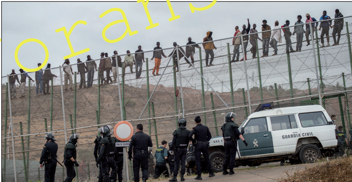
Europa schottet sich, wie hier in der spanischen Exklave Melilla, mit meterhohen Zäunen vor Flüchtlingen ab.