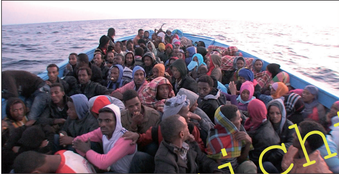
260 afrikanische Flüchtlinge in einem Boot auf dem Mittelmeer – ihr Ziel: die italienische Insel Lampedusa.

Wie ergeht es Menschen, die sich als Flüchtlinge auf den Weg nach Europa machen? Die Band „Die Toten Hosen“ haben einen Song mit dem Titel „Europa“ geschrieben.