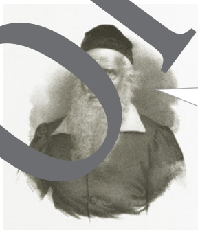
Friedrich Ludwig Jahn

Dein Herz soll im Einklang mit dem Herzen der Erde schlagen. Du sollst fühlen, dass du ein Teil des Ganzen bist, das dich umgibt.