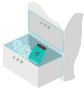
Grafikerin: Sylvana Timmer