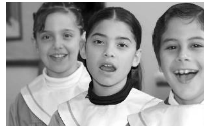
Mitglieder eines Kinderchors

Das Wort, das übrig bleibt, bezeichnet eine weitere Männerstimme: Bariton .