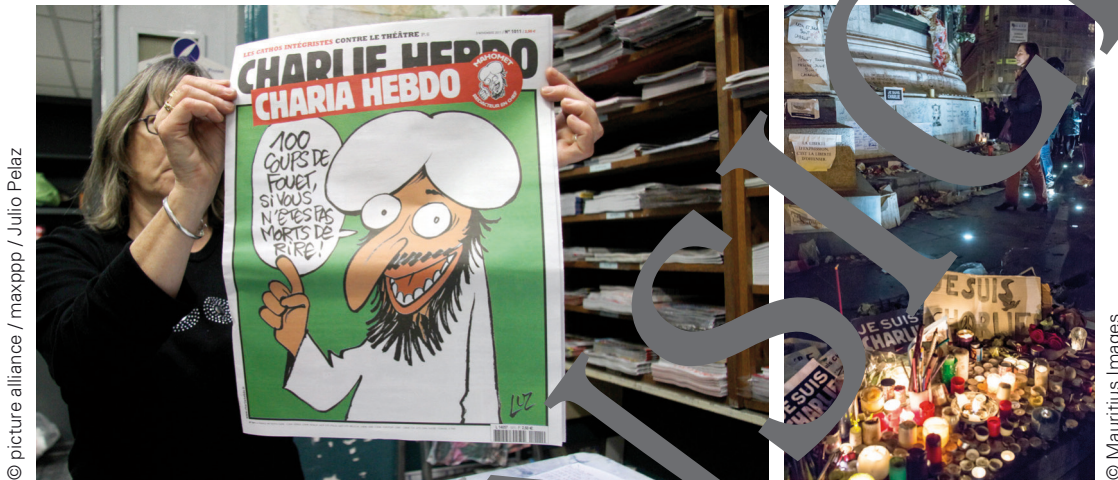
L'attentat dans la rédaction de "Charlie Hebdo" a secoué le monde entier.

Immer wieder ereignen sich Anschläge die Menschen weltweit. Das ist nicht nur eine Erscheinung des 21. Jahrhunderts ist, sondern auch eine geschichtliche Dimension und unterschiedliche Motive, die Frankreich hat, sollen die Lernenden in dieser Lernreihe anhand von schülerorientierten Methoden erfahren. Sie untersuchen beispielsweise die Anschläge rund um „Charlie Hebdo“, analysieren eine Karikatur des Satiremagazins und diskutieren in einer „table rond“, ob und wie man derartige Anschläge verhindern könnte.