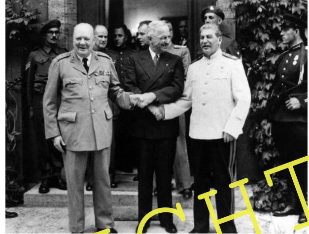
Sie verhandelten über Deutschlands Zukunft: Die Großen Drei (Winston Churchill, Harry Truman, Josef Stalin)

Die Schülerinnen und Schüler erarbeiten in einem Gruppenpuzzle die wirtschaftlichen, politischen und territorialen Bestimmungen des Potsdamer Abkommens. Auf dieser Grundlage diskutieren sie die Frage nach der Bedeutung der Potsdamer Beschlüsse für die doppelte Staatsgründung im Jahr 1949.