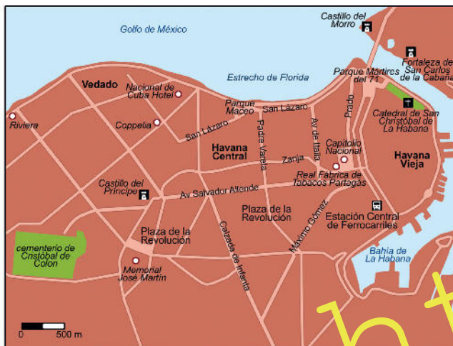
Ilustración: Oliver Wetterauer