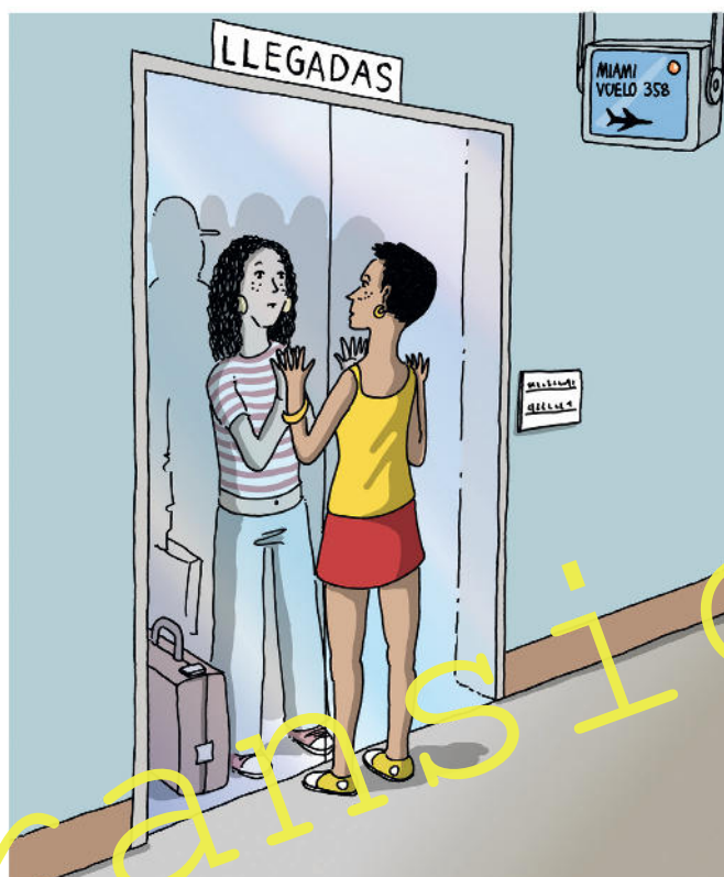
Lisa und Yolanda – zwei Lebensweisen treffen aufeinander