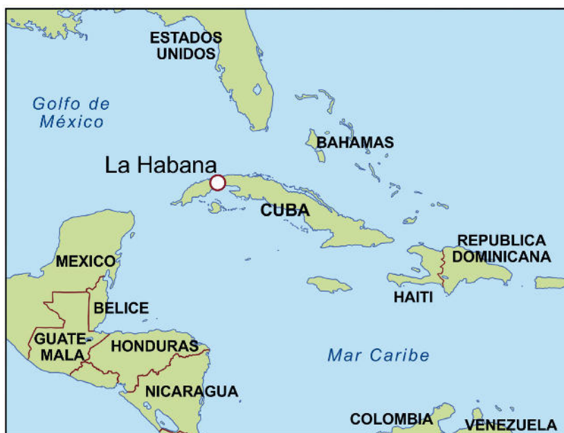
Ilustración: Oliver Wetterauer