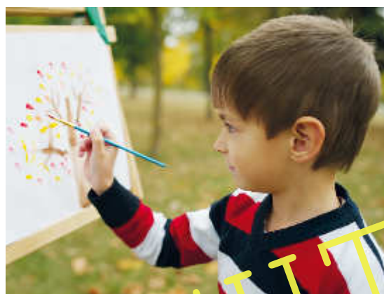
Kein Baum ist wie der andere

G heimnisvolle Schattenwälder fotografieren, Bäume sprechen lassen und selbst in die Rolle eines Baumes schlüpfen – die Kinder machen im Rahmen dieser Baumwerkstatt viele Erfahrungen mit ganz unterschiedlichen künstlerischen Techniken. Egal, ob beim experimentellen Zeichnen mit Zweigen, beim Pusten eines Baumbildes, bei einer textilen Collage oder bei der Gestaltung konkreter Poesie – die Kinder erleben sich nicht nur als kreative Gestalter ihrer Umwelt, sondern schärfen auch ihre Wahrnehmung ihr gegenüber. Freuen Sie sich auf viele unterschiedliche Arbeitsergebnisse Ihrer Schüler.