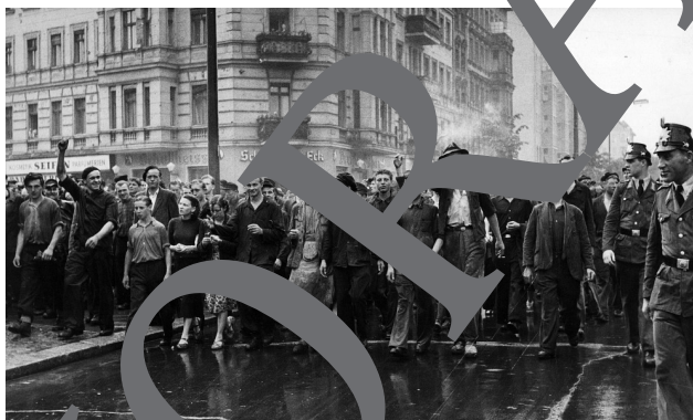
17. Juni 1953: Demonstrationszug der Stahlwerker von Hennigsdorf