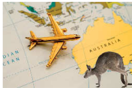
Australia – a continent to be discovered