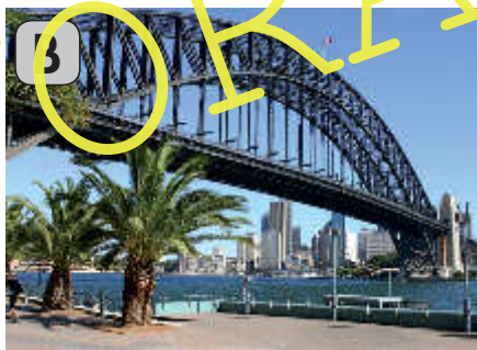
Sydney Harbour Bridge

Dad: Mhm ...? Was ist das Besondere an Sydney?