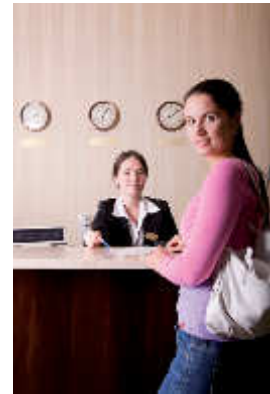
A hotel in Alice Springs