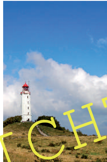
Der Leuchtturm Dornbusch auf Hiddensee

Aus: Baade, Michael: Sturmkinder .... Auf Hiddensee und anderen Inseln - Lyrik und Prosa. Rostock: Ingo Koch Verlag 2006. © Michael Baade