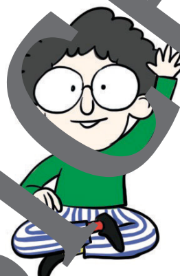
Der kleine Herr Paul

E in winziger Kerl, der sich als der kleine Herr Paul vorstellt, Seifenblasen blubbert und manchmal Buchstaben verdreht oder ganz durcheinanderwirft, komische und wunderbare Dinge zaubert und das Klassenzimmer sauber hält – für Leon, Freddy und Mia ist der kleine Herr Paul einfach der Größte ... Die lustige Geschichte ist in mehrere Abschnitte in unterschiedlichen Schwierigkeitsstufen aufgeteilt. So gibt es je nach Leseniveau Texte zum Vorlesen und Selbstlesen, Übungen zum Hör- und Leseverstehen und zu verschiedenen Lesetechniken, Aufgaben zum Nachdenken und zum Lachen.