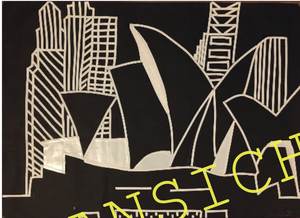
Schülerbeispiel – entstanden aus Klebeband