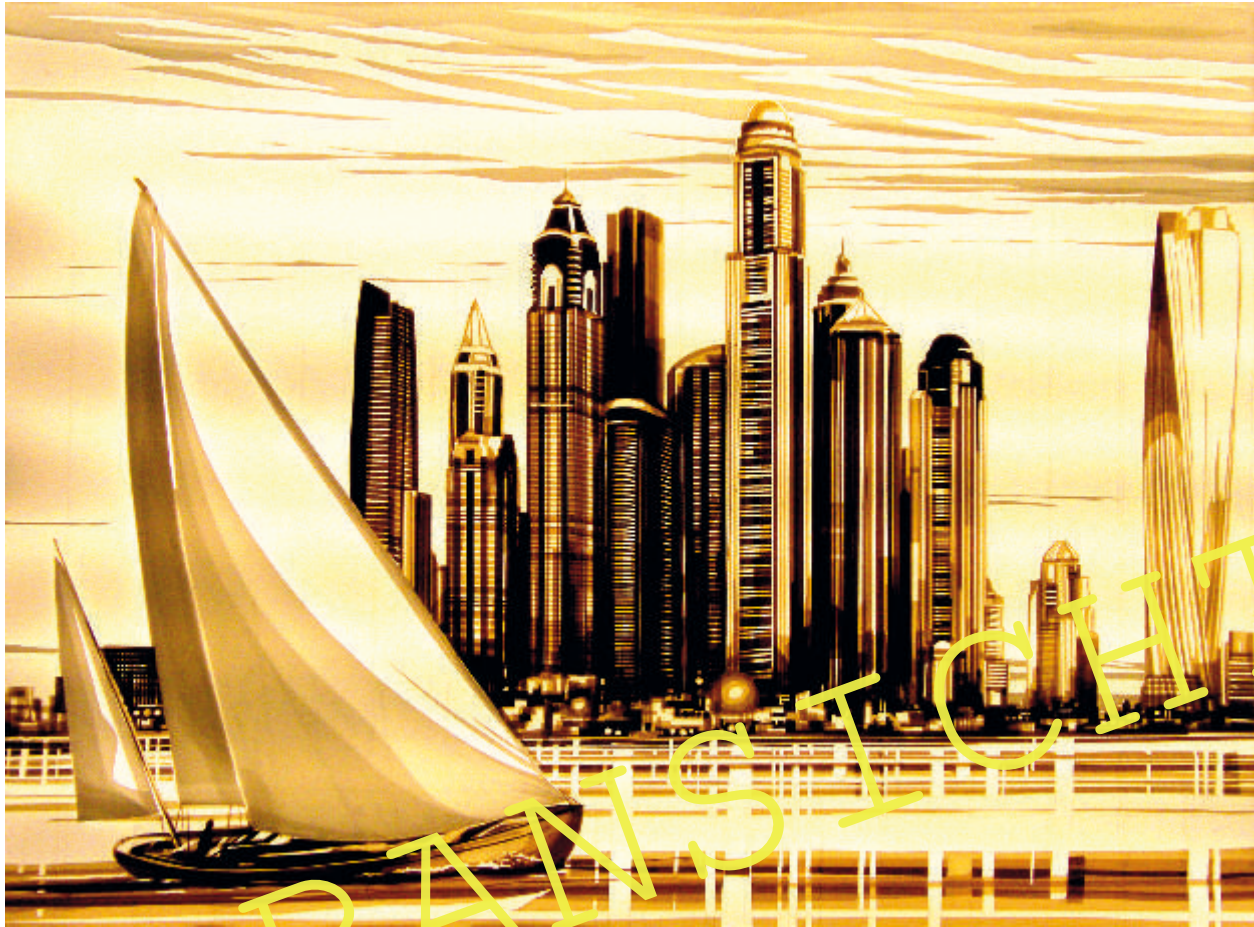
© Max Zorn. (www.maxzorn.com) Quelle: www.instagram.com/maxzornstreetart/?hl=de