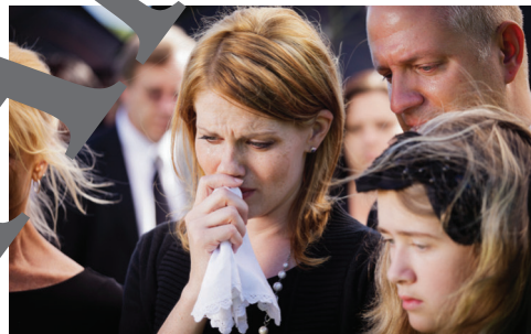
Angehörige von Corona-Todesopfern