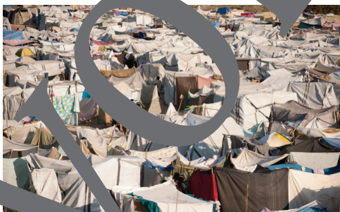
Flüchtlingslager in Europa