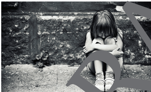
Kinderarmut in Deutschland

Text: Einheitsübersetzung der Heiligen Schrift. © 2016 Katholische Bibelanstalt, Stuttgart.