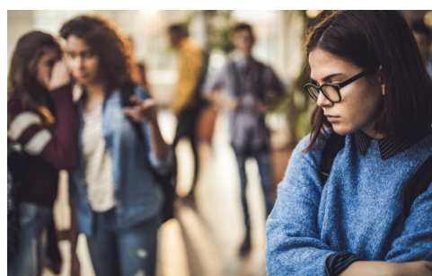
Mobbing in der Schule