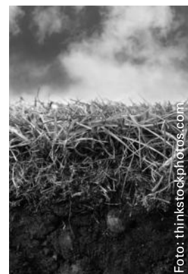
Was macht der Boden mit dem Wasser?

Wasser ist ein wesentlicher Bodenbildungsfaktor. Es gelangt mit dem Niederschlag in den Boden, wo es von den Pflanzenwurzeln aufgenommen wird oder als Sickerwasser in tiefere Schichten gelangt. Dabei werden Nährsalze gelöst und aus dem oberen A-Horizont (Auswaschungshorizont) in den darunter liegenden B-Horizont (Anreicherungshorizont) transportiert. Grobkörnige Böden sind wasserdurchlässiger als feine, da es aufgrund der größeren Poren schneller versickert. Diese Eigenschaft bezeichnet man auch als Wasserdurchlässigkeit . Die Fähigkeit des Bodens, Wasser zu speichern, ist bei feinkörnigen Böden größer, da sie ein insgesamt größeres Porenvolumen haben und von den dort vorhandenen Teilchen mehr Wasser aufgenommen werden kann. Diese Eigenschaft bezeichnet man auch als Wasserspeichervermögen .